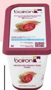
Purée de figue de barbarie rouge sans sucres ajoutés Les vergers Boiron