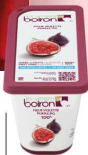
Purée de figue sans sucres ajoutés Les vergers Boiron