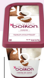
Crème de coco sans sucres ajoutés Les vergers Boiron