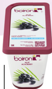
Purée d'açaï sans sucres ajoutés Les vergers Boiron

Moules "Truffles 5" de Silikomart Moules "Nigiri" de Silikomart