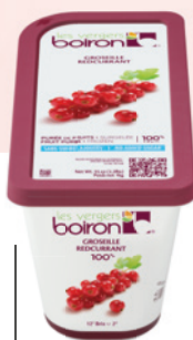
Purée de groseille sans sucres ajoutés Les vergers Boiron