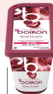
Purée de pêche sanguine sans sucres ajoutés Les vergers Boiron