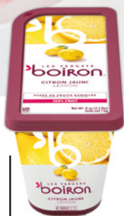
Purée de citron jaune sans sucres ajoutés Les vergers Boiron