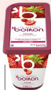
Purée de fraise 100% sans sucres ajoutés Les vergers Boiron