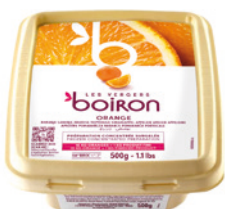
Préparation concentrée surgelée orange Les vergers Boiron