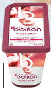
Purée de pêche blanche sans sucres ajoutés Les vergers Boiron