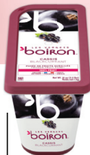
Purée de cassis sans sucres ajoutés Les vergers Boiron

Moules Hana 87, Globe 26, Hana 1000 de Silikomart