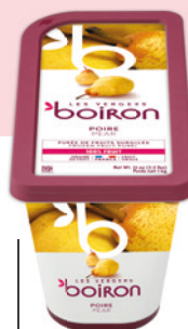
Purée de poire sans sucres ajoutés Les vergers Boiron