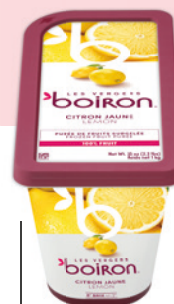
Purée de citron jaune sans sucres ajoutés Les vergers Boiron