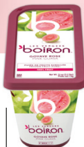
Purée de goyave sans sucres ajoutés Les vergers Boiron

Moules Promise 65 et Essenziale 30 de Silikomart