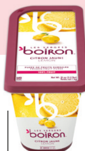
Purée de citron jaune sans sucres ajoutés Les vergers Boiron